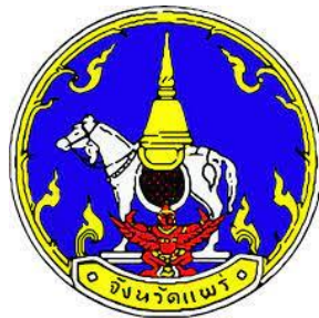
ตราประจำจังหวัดแพร์

ตราประจำจังหวัด รูปพระธาตุช่อแฮ ประดิษฐานบนหลังม้า